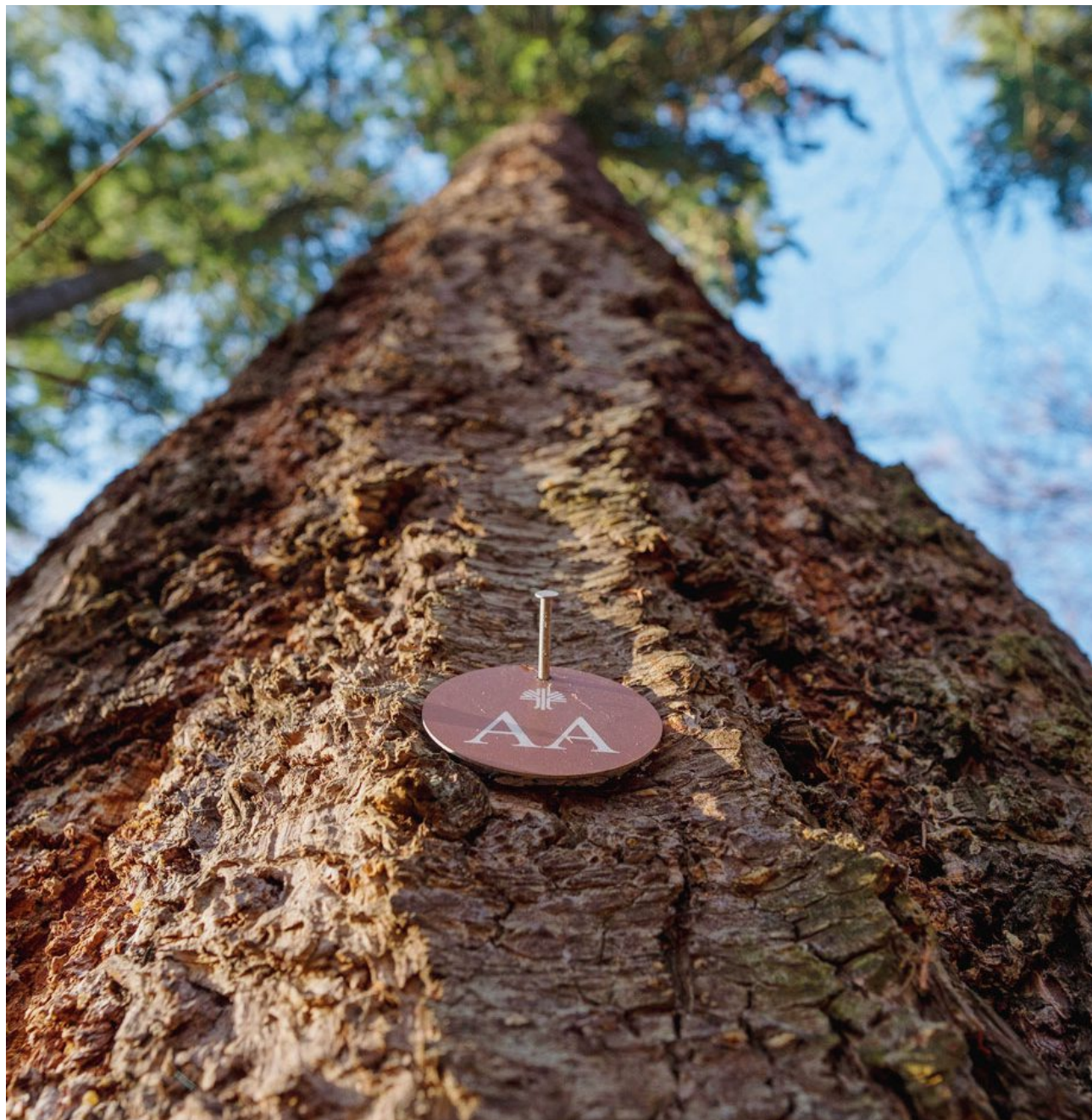
Die rote Plakette zeigt an: Bei diesem Baum wurde die Asche Verstorbener beigesetzt.

Dennoch: Die unterschiedlichen Preise der Grabstätten sind